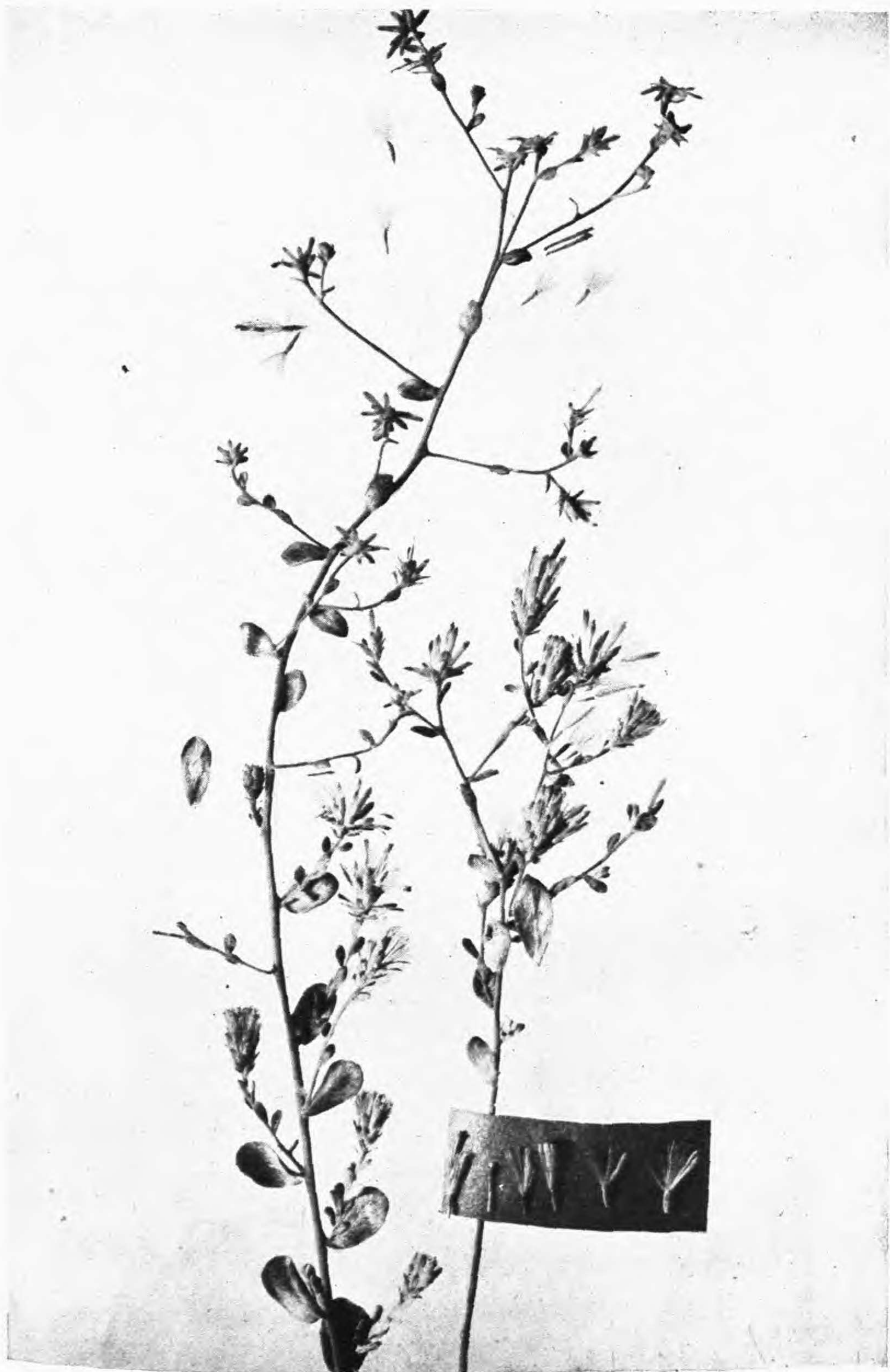
Jasonia sericea Batt. et Trab.